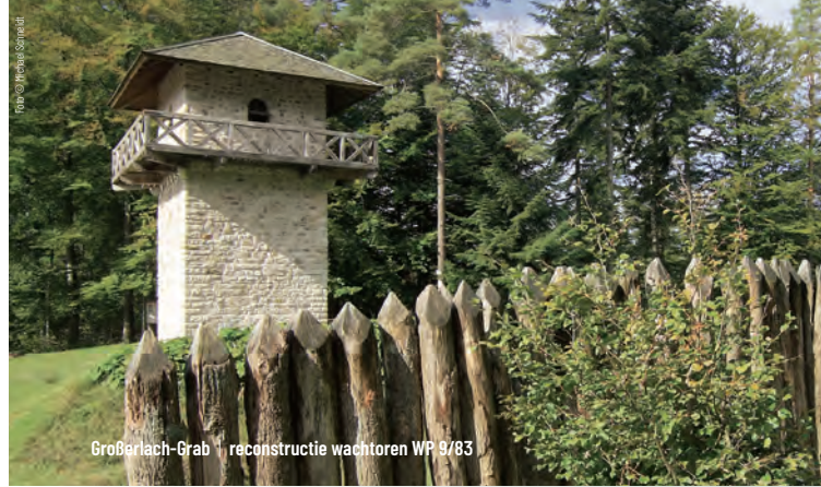
GroBerlach-Grab | reconstructie wachttorens WP 9/83